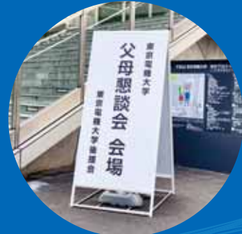
キャンパス父母懇談会