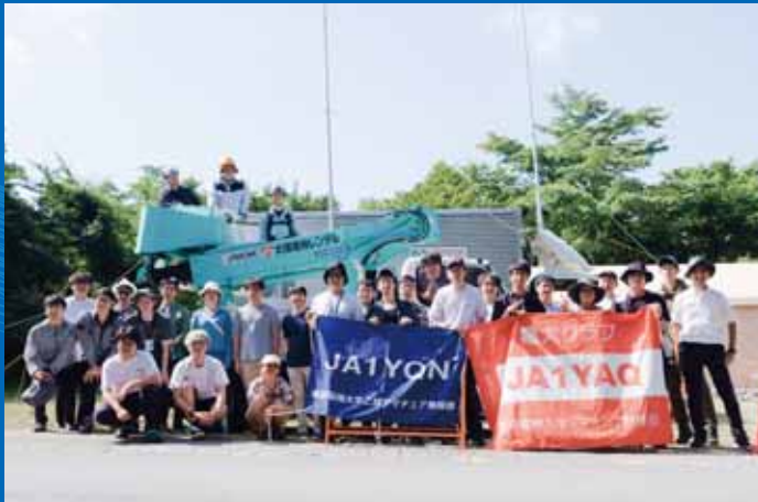
アマチュア無線部