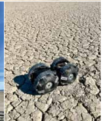
砂漠でのテストの様子