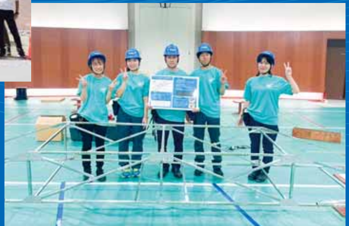
TDU プリコンサークル