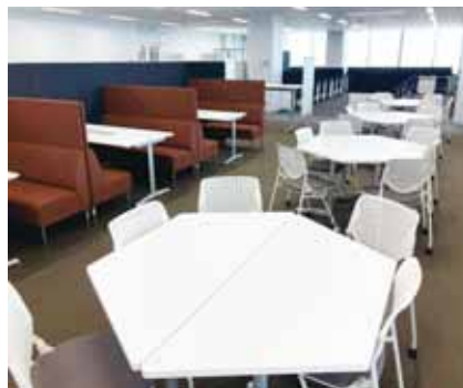
東京千住キャンパス5号館 10階大学院フリーアドレス研究室