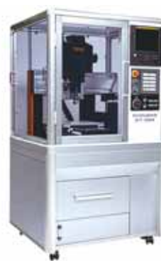
超小型マシニングセンタ