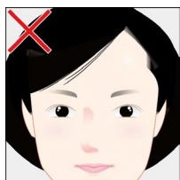
枠からはみ出ている