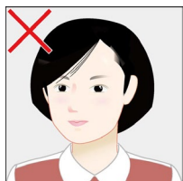
正面を向いていない