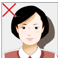
背景や顔に影がある