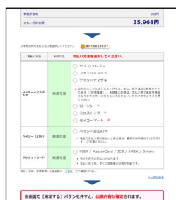
②支払い方法を選択する