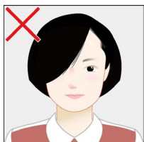
髪で目元や顔の輪郭が隠れている