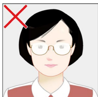
照明がメガネに反射して目元が鮮明でない