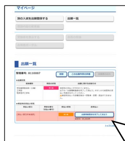
①マイページで「出願登録を完了して支払う」を押す

出願登録が完了したら、マイページに戻り、「出願登録を完了して支払う」ボタンを押してください。画面の指示に従って支払い方法を選択・確定し、各支払い方法に従って入学検定料を納入してください。