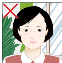
背景が無地でない/他の物が写り込んでいる