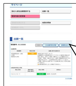
④納入が完了すると「支払い済み」が表示され、志願票が出力できるようになる