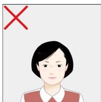
小さく写っている