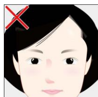
枠からはみ出ている