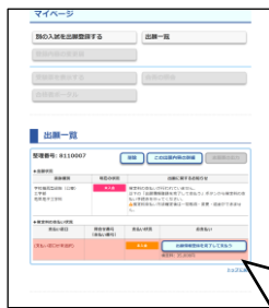
①マイページで「出願登録を完了して支払う」を押す

出願登録が完了したら、マイページに戻り、「出願登録を完了して支払う」ボタンを押してください。画面の指示に従って支払い方法を選択・確定し、各支払い方法に従って入学検定料を納入してください。