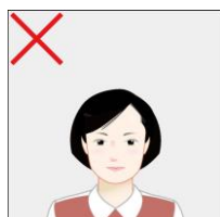
小さく写っている