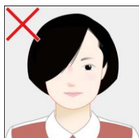
髪で目元や顔の輪郭が隠れている