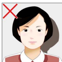
背景や顔に影がある