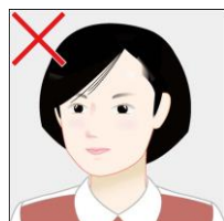
正面を向いていない