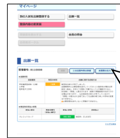
④納入が完了すると「支払い済み」が表示され、志願票が出力できるようになる