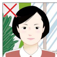
背景が無地でない／他の物が写り込んでいる