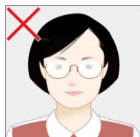
照明がメガネに反射して目元が鮮明でない