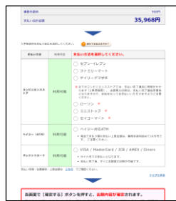
②支払い方法を選択する