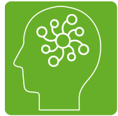
知能情報デザイン コース