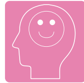
アミューズメント デザインコース