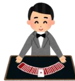
暗号の神秘? カードマジック体験 (橋本研究室)