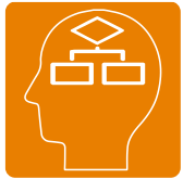
コンピュータ ソフトウェアコース